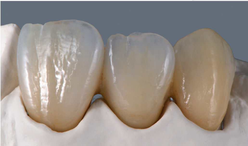
Zeichnung und Restauration gefertigt von ZTM German Bär, St. Augustin

Die lichteptischen Eigenschaften der natürlichen Zähne werden durch die opalsierenden Inzisal- und Transluzenzmassen mit minimalem Aufwand einfach und treffsicher reproduziert.